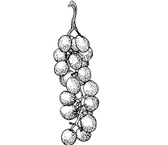
נטף בלא כתף