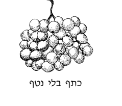
כתף בלי נטף

א מסופר: ההוא ליזאה דהוה חטף מתנתא (לוי אהז שהיה