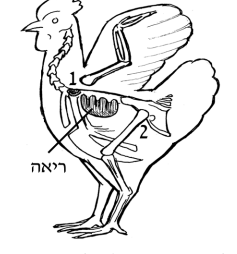
1) שמוטת גף (כנף). 2) שמוטת ירך. שמה ניקבה הריאה ריאות העוף, בשונה מבהמה, דבוקות לצלעות, ומשום כך, פגיעה בחיבור הכנף לצלעות עלולה לפגום בריאה. וראה נספח תמונות עמ' 7.

* פינטור"א (צ"ל: פינטור"א) מן הצרפתית העתיקה pointure – מנוקד, מנומר.