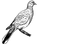
תור, ציור מאת ג'ורג' סטיוארט

ראה נספח תמונות עמ' 14. התור (Streptopelia) הינו סוג ציפור בגודל בינוני־קטן ממשפחת היוניים. למרבית המינים בסוג קווי דמיון משותפים: החלק העליון חום בהיר והחלק התחתון בגוני וורוד־אדום. לחלקם עיטור על הצוואר (צווארון) בצבעי שחור ולבן. התור בתורה ובמקורות חז"ל הוא התור המצוי (Streptopeliaurtur). ניתן לראותו בהמוני בזמן שהוא חולף במהלך נדידתו בסתיו (בין אוגוסט לראשית אוקטובר) ובאביב (אפריל–מאי). בארץ ישראל מצויים גם מיני תור אחרים, דוגמת תור הצווארון (S. f. otocodeca), התור המזרחי, והצוצלת (S. senegalensis).