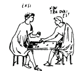
ציור רומי של משחקים בקוביא

ואליבא [ולפי שיטתו] של ר' עקיבא שאמר: אדם אוסר עצמו בכל שהוא, שאם נשבע שלא יאכל – הרי אסר על עצמו בכל שיעור. משמע שריש לקיש עצמו סבור כי חצי שיעור אין בו איסור כלל! וכי תימא היתר מן התורה, קא חייל [ול] קרבן שבעה עליו אף שאסור מדברי סופרים, והתנן [והרי שנינו במשנה]: שבועת העדות , שמשביעים אדם שיעיד על דבר שראה וידע, אינה נוהגת אלא בראויין להעיד , ואם השביעו אדם שאינו ראוי להעיד, אף שלא העיד – אין השבועה חלה עליו. והוינן בה [והיינו עוסקים ומתקשים בבעיה זו]: למעוטי מאי [למעט את מה] באה ההגדרה "הראויין להעיד"? שהרי קודם לכן נאמר ששבועת העדות אינה חלה על נשים, קרובים ופסולים: רב פפא אמר: למעוטי מלך, שאף שאין המלך נמנה ברשימה של הבלתי ראויים , דין הוא שאין המלך מעיד בפני בית דין מפני כבודו. רב אחא בר יעקב אמר: למעוטי [למעט] משחק בקוביא (שהוא פסול לעדות מדברי סופרים) והא [והרי] משחק בקוביא מדאורייתא מיחויב הזו [מן התורה ואין הוא] להעיד ורבנן הוא [וחכמים הם] שפסלוהו מלהעיד, ובכל זאת אמרים אנו כי לא קא חיילא עליה שבעה [שלא חלה עליו שבועת העדות] מן התורה, אף שאין איסורו אלא מדברי חכמים. אף כאן, אין שבועת הביטוי חלה אף כאשר אין הדבר אסור אלא מדברי סופרים! ודוחים: יש לחלק, שאני התם [שונה] [שם] בענין העדות שאמר קרא [הכתוב]: "אם לוא יגיד ונשא עוונתי (ויקרא ה, א), שהעונש בא לאדם שצריך להעיד ולא העיד, והאי לאו הגדת עדות כלל] שכיון שבפועל אין בית הדין מקבל את עדותו, והתורה תלתה את שבועת העדות ביכולת להעיד, הרי מי שנבצר ממנו להעיד מפני כל סיבה שהיא, אין שבועת העדות חלה עליו. אבל אין הדבר כן לגבי שבועת ביטוי, ואין איפוא להוכיח דבר, ופירושונו הראשון עומד במקומו.