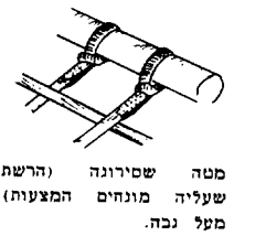
מטה שסירוגה (הרשת שעליה מונחים המצעות) מעל נכה.