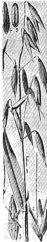
”שבולת שועל” (שיפון?) Avena sativa

נראה כי הכלניתא היא גומא הפפירוס Cyperus papyrus ממשפחת הגמאים. זהו צמח עשבי רב שנתי בעל קנים זקופים וגבוהים (5–2 מטרים) המסתיימים בתפרחות גדולות דמות סוכך. הצמח גדל בביצות באיזורים שונים בארץ. קני השרש של הגומא שקועים כרגיל בתוך המים, ומהם גדלים בכל שנה קנים חדשים. הגומא שמש להכנת רפסודות וסירות קלות ומתוכו יצרו את נייר הפפירוס. ובקני השרש השתמשו לאכילה. בימינו רוב שמושו להכנת מחצלות.